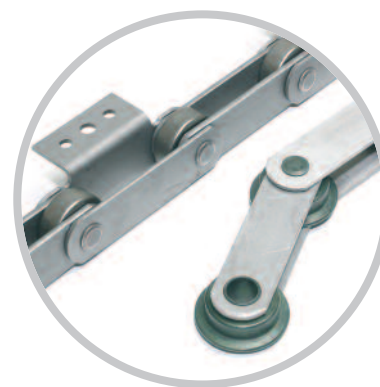
Chaînes de manutention