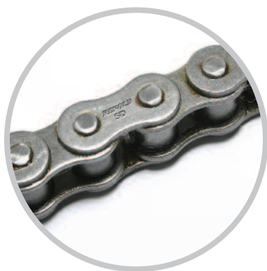
Chaînes de transmission