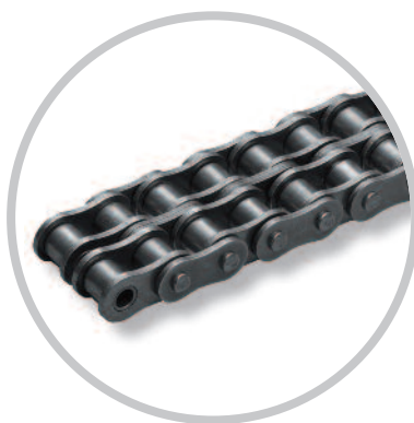
Chaînes à rangées multiples