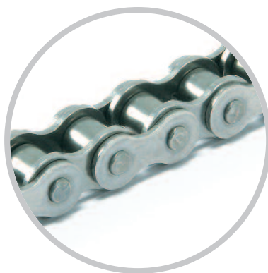
Chaînes en acier inoxydable